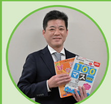
阪神支部長 (株) 清風堂書店 (株) フォーラム・A 面屋 尚志

MacBook Air と「さんすけ」！「わ！そんなプレゼンでももらえるの！」の精神でビジュアルも重視し、驚きをおり混ぜて確実な家造りを提供します。